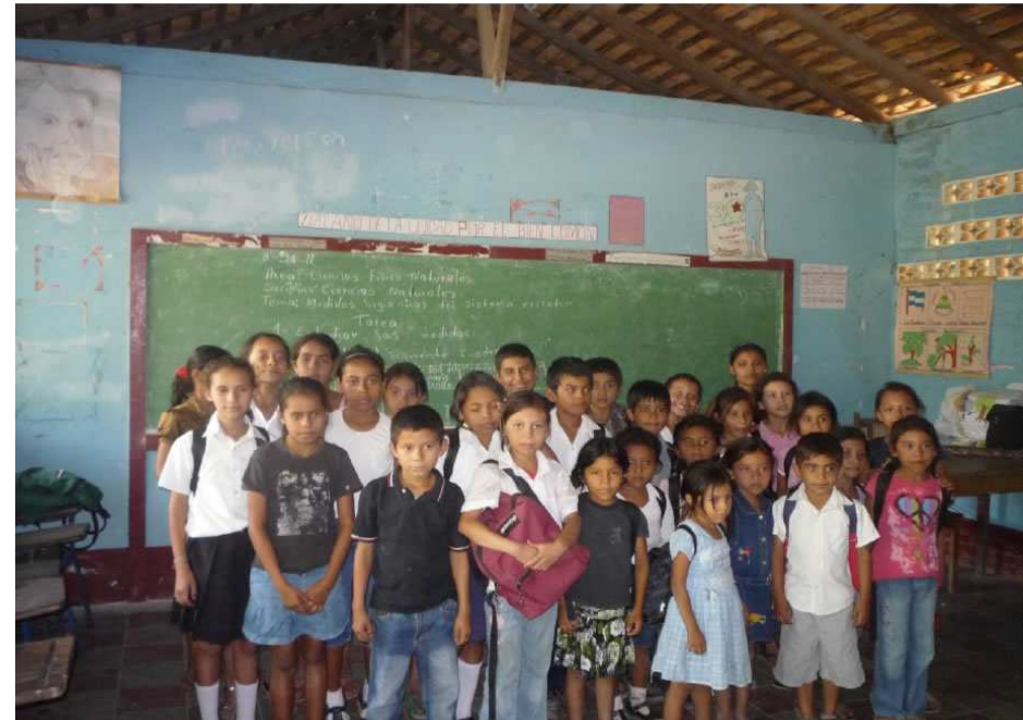
Alumnos y alumnas de ADENOCH, Región de Chinandega, Nicaragua.

En total, 86 niños y niñas fueron becados por MAYAS en 2014. Entre otros, MAYAS financia el coste de material escolar, matrícula del colegio, transporte, clases de nivelación y evaluaciones psicológicas y físicas de los alumnos y alumnas becadas.